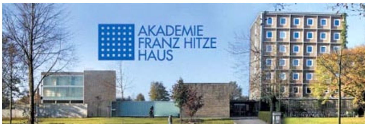
Das Franz-Hitze-Haus in Münster ist unser Tagungshaus in diesem Jahr ( www.franz-hitze-haus.de ).