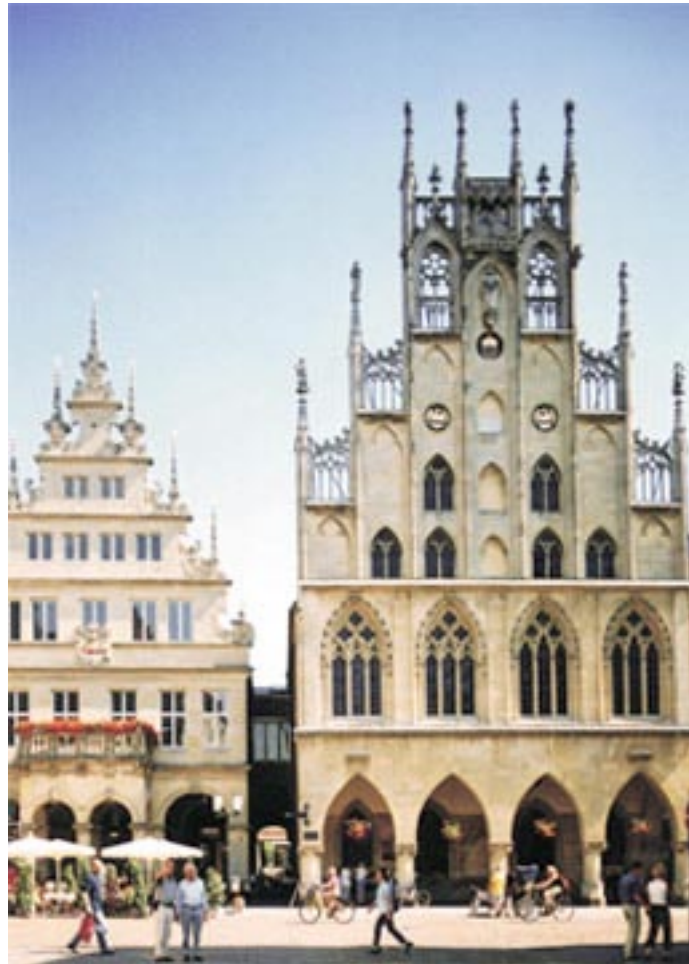
Rathaus Münster.