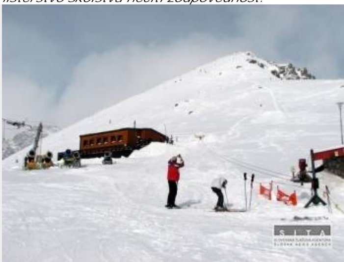
Slovenský deaflympijský výbor na cele s

Za situáciu okolo zimných hier nepocujúcich je podľa bývalého člena organizačného štábu Chudého zodpovedné slovenské, aj medzinárodné deaflympijské hnutie. Ministerstvo školstva necíti zodpovednosť.